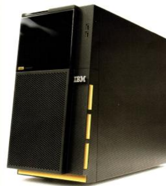
Die Lotus Foundations Appliance mit integriertem Plattenbackup und LCD-Steuerkonsole

Die Server- und Software-Lösung beinhaltet neben dem Lotus Domino Server und dem Lotus Notes Client der Version 8.5 zusätzlich Anti-Spam-, Anti-Virus- und Firewall-Funktionalitäten, Backup und Disaster Recovery sowie Anwendungen zur Bearbeitung von Textdokumenten, Tabellen und Präsentationen.