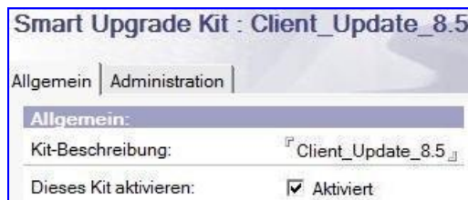
Ein Installation-Kit in der Smart Upgrade Datenbank

Hierzu benötigen Sie zuerst die sogenannten Installation-Kits für die neue Version. Diese können Sie ganz einfach von der IBM Passport Advantage Webseite herunterladen. Diese Kits werden in der Smart Upgrade Datenbank gespeichert und von dort an die