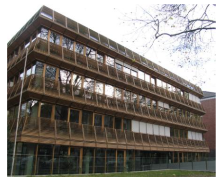
Euro RSCG in Düsseldorf

Euro RSCG Deutschland ist Teil der Euro RSCG Worldwide, eins der drei führenden Agenturnetzwerke der Welt. Es ist mit 233 Büros und 12 000 Mitarbeitern in mehr als 75 Ländern vertreten. Von den international renommierten Marketing-Publikationen Campaign und Advertising wurde Euro RSCG als »Advertising Network of the Year 2006« und als »Global Agency of the Year 2006« ausgezeichnet.